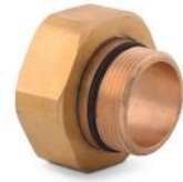
Unión Reducción M32x1.5 - G 1"