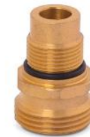
Cuerpo de Eurocono