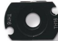
Mordazas para herramienta de cabezal giratorio

CÓDIGO HERR.ABOCARDADO-A DIMENSIONES Ø16-32