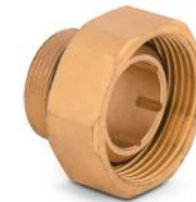
Conjunto de Media Unión