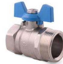
Válvula esférica recta