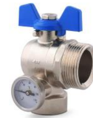
Válvula esférica angular (con termómetro)