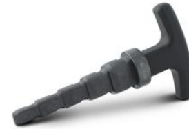
Herramienta de abocardado

CÓDIGO HERR.ABOCARDADO-A DIMENSIONES Ø16-32