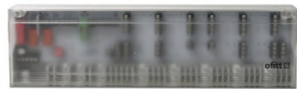
Central de 6 zonas 230V