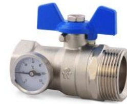
Válvula esférica recta (con termómetro)