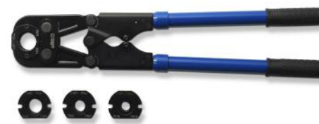
Herramienta manual de cabezal fijo y brazos extensibles con mordazas de prensado TH (Ø16-20-25-32)