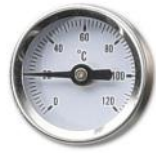
Termómetro para mandada y/o retorno