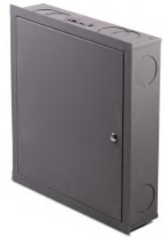
Gabinete para calefacción