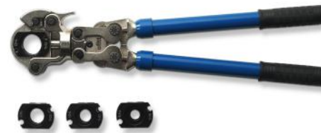
Herramienta manual de cabezal giratorio y brazos extensibles con mordazas de prensado TH (Ø16-20-25-32)