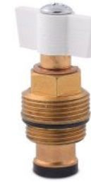
Válvula ON/OFF para colector