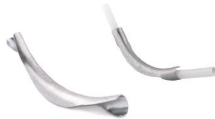
Curva guía a 90°