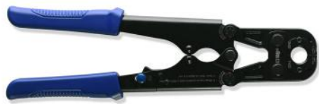
Herramienta manual de cabezal fijo Perfil TH Ø20