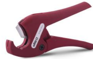
Cortadora de tubo plástico hasta Ø32