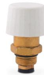
Válvula termostatizable para colector