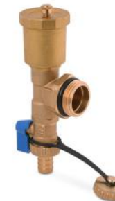
Válvula de drenaje y venteo