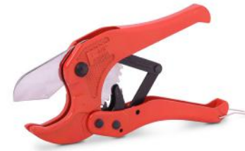
Cortadora de tubo plástico con criquet hasta Ø42