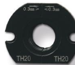
Mordazas para herramienta de cabezal fijo