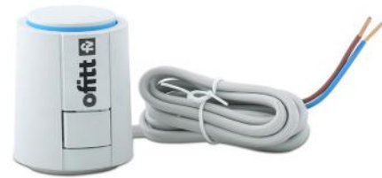
Actuador termostático 230V NC