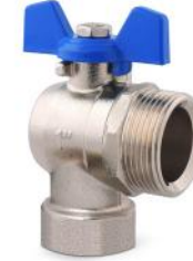
Válvula esférica angular