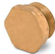
Tapón salida de colector