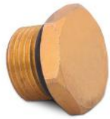
Tapón para extremo de colector